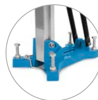
Base à cheviller compacte