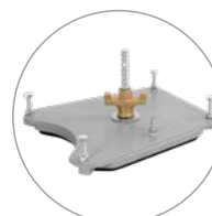
Plaque de fixation sous vide en option

Le DRA150 est idéal pour les travaux d'équipement électrique et les travaux d'installation. Ce bâti de carottage est adapté aux couronnes de carottage de 550 mm de long et