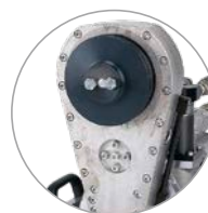
Bras pivotant à réducteur avec flasque de séparation rapide pour changement de lame facile