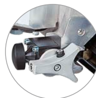
Coulisses avec système de blocage ergonomique et réglage fin

La bête de somme parmi les scies murales hydrauliques. L'utilisation du flasque de séparation rapide au niveau du bras pivotant permet un changement de lame facile et rapide, et une utilisation plus simple pour