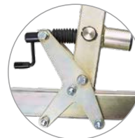
Kabel kan eenvoudig worden geplaatst en gespannen