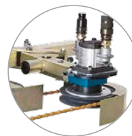
Hydraulische standaardaan- drijvingsmotor