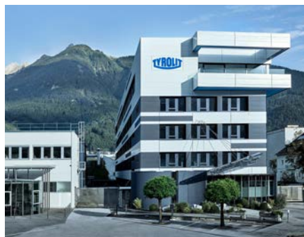
Siège social de TYROLIT à Schwaz, Autriche

Cette entreprise familiale, dont le siège social se situe à Schwaz (Autriche), combine les forces du Groupe Swarovski dynamique dont il fait partie à une expérience d'entreprise individuelle et technologique longue d'un siècle.